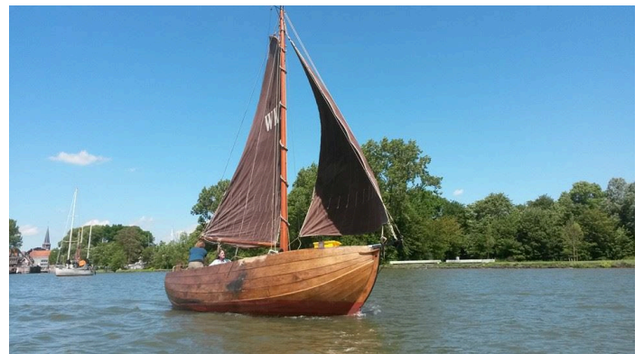
Staverse Jol WK2

Terwijl we naar de ligplaats voeren zei Rob: jij...jij bent nog gekker dan dat ik ben!!!